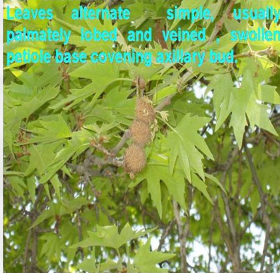
Spherical heads of unisexual flowers

Leaves alternate simple, usually palmately lobed and veined, swollen petiole base covering axillary bud.